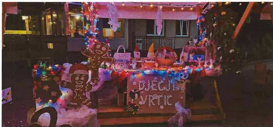
Sudjelovanje Dječjeg vrtića na Adventu u Klenovniku

Suradivali smo kontinuirano s jedinicom lokalne uprave i samouprave Općinom Klenovnik i načelnikom Općine ( Upravna vijeća, sufinanciranje programa, nabava potrebne opreme, Dan vrtića, Dan općine, Dani kruha, Advent u Klenovniku...)