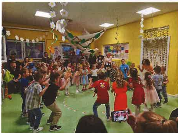
Završna svečanost – pjesma Hello, Trick or Treat

Nakon rujanskih adaptacija, 2. listopada 2023. započelo se s provođenjem programa. Igraonice su održavane tri puta tjedno (ponedjeljak, srijeda, četvrtak) u trajanju od 45 minuta. Radi osiguranja individualnog pristupa i povećanja dječje koncentracije, djeca su bila podijeljena u dvije grupe od 12-ero i 11-ero polaznika. U siječnju je, nakon uočenog pada interesa djeteta, sugeriran i realiziran jedan ispis. Odrađen je 71 sat i 15 minuta godišnje satnice. U dogovoru s roditeljima, program je završen s 31. svibnjem 2024. kada je i održana njegova završna svečanost.