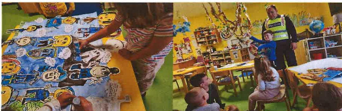
Izrada policijske postaje