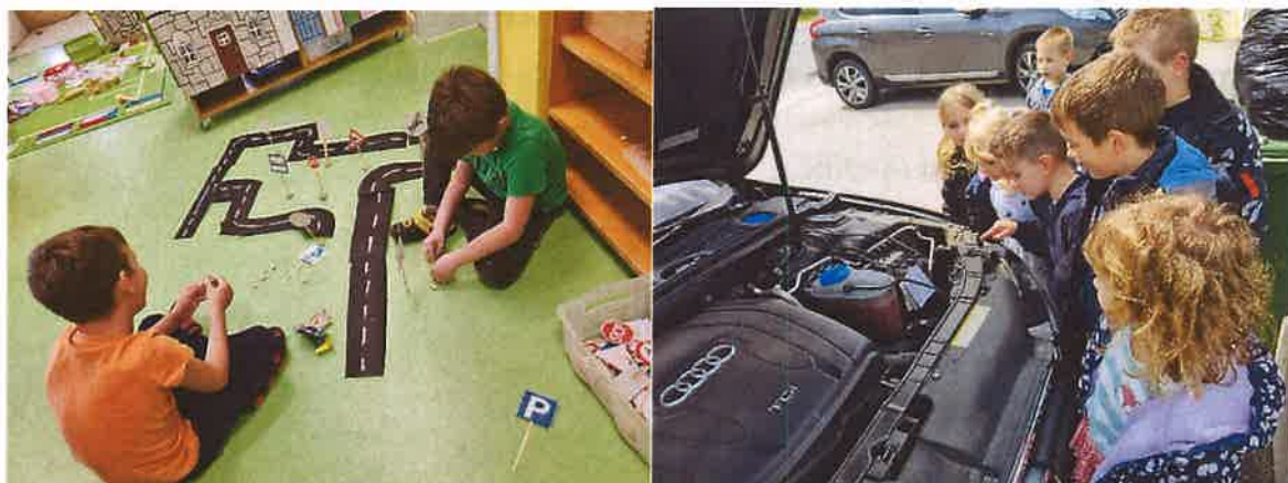
Istraživanje prometnih znakova-konstruktivna igra – lijevo; promatranje dijelova motora auta- desno

Projekt je proizašao iz grupne potrebe za povećanjem odgovornog i savjesnog ponašanja u prometu, što je osobito dolazilo do izražaja tijekom šetnji lokalnim mjestom. Cilj je projekta bio istražiti, upoznati i otkriti principe funkcioniranja prometa radi mogućnosti boljeg predviđanja različitih scenarija, a s namjernom izgradnje sebe u odgovornog sudionika u prometu koji u skladu s dobi vodi računa o svojoj sigurnosti. Projekt je trajao od kraja ožujka do sredine svibnja. Dobrobiti projekta uključivale su prepoznavanje osnovnih znakova u prometu, osvještavanje sebe kao sudionika prometa, detekciju svog puta od kuće do vrtića, povećanje svijesti o nužnosti vrlo opreznog prelaženja ceste preko pješačkog prijelaza, razumijevanje osnova principa rada benzinskog motora, procjenjivanje i detekciju opasnih prometnih situacija, poznavanje triju hitnih službi (policija, vatrogasci i hitna pomoć) i njihovih brojeva telefona te mogućnost kratkog opisa njihovih djelatnosti.